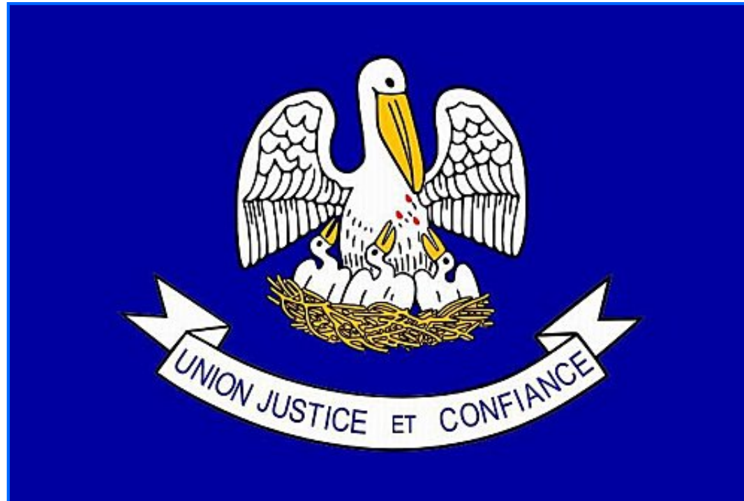
Drapeau de la Louisiane.

La dernière occurrence de cette séquence " éli " se trouve en Apocalypse ( version complète illustrée ).