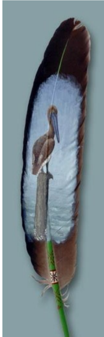
Pélican sur plume