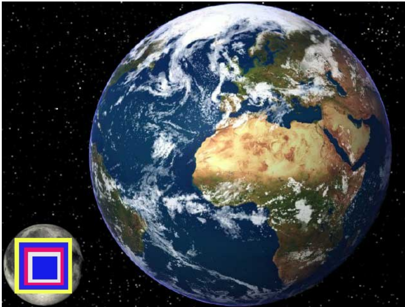
Dimensions respectives de la lune, la Jérusalem céleste et de la terre,

Selon cette vue plus détaillée, on se rend compte par exemple que si la Jérusalem Céleste survolait le bassin Méditerranéen, la plus grande partie en serait occultée et se retrouverait dans l'obscurité complète!