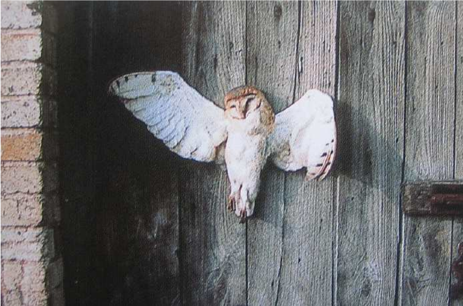
Chouette effraie clouée sur une porte de grange